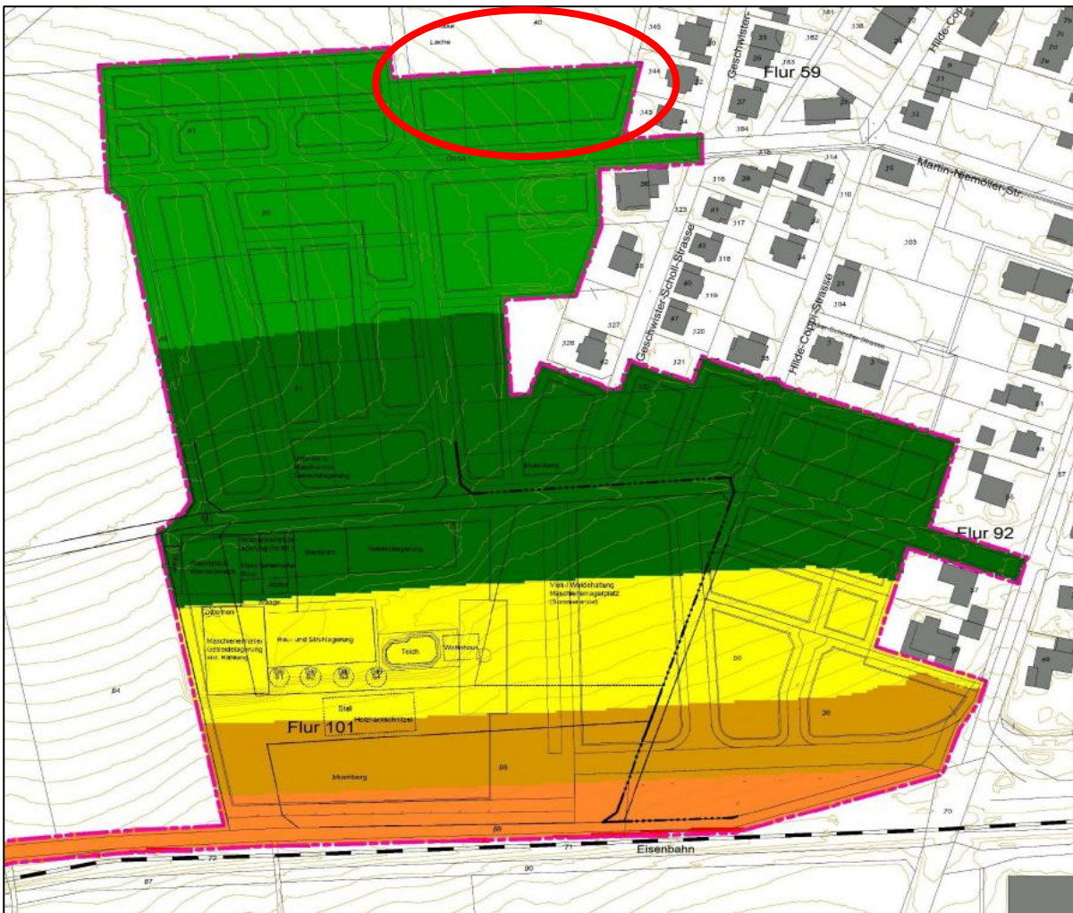
Abb. 4: Geräuschbelastung im Nachtzeitraum durch den Schienenverkehr (unmaßstäblich) (TÜV Hessen, 2019)

Die Belastung durch den Schienenverkehr wurde vom TÜV Hessen 2019 berechnet. Wenige südliche Teile des Geltungsbereichs der Seniorenwohnanlage sind von ca. 35 - 40 dB(A) (hellgrün) Geräuschbelastung betroffen (Abb. 4). Die Berechnungen des TÜV Hessen deuten also an, dass der nächtliche Immissionsrichtwert laut 6.1 g (TA Lärm) von 35 dB(A) theoretisch überschritten werden könnte. Planungsansätze des Architekturbüro Wohnbau + sehen im südlichen Teil des Geltungsbereichs Räume für ergänzende Dienstleistungseinrichtungen (SO II) sowie betreutes Wohnen mit Service (SO III) vor. Diese Nutzungsarten haben laut TA Lärm nächtliche Immissionsrichtwerte zwischen 40 und 45 dB(A). Diese Richtwerte werden eingehalten. Da Seniorenwohnanlagen weniger von den Auswirkungen der Geräuschbelastung beeinträchtigt sind, sollte es genügen, keine Räume mit Schlaf Funktion in südlicher Richtung auf SO II oder SO III zu errichten. Somit wird einer eventuellen Störung durch Geräuschbelastung vorgebeugt, da weiter nördlich von der Einhaltung des Immissionsrichtwerts in Kurgebieten, für Krankenhäuser und Pflegeanstalten von 35 dB(A) ausgegangen werden kann. Es wird empfohlen Schallschutzfenster zu verwenden.