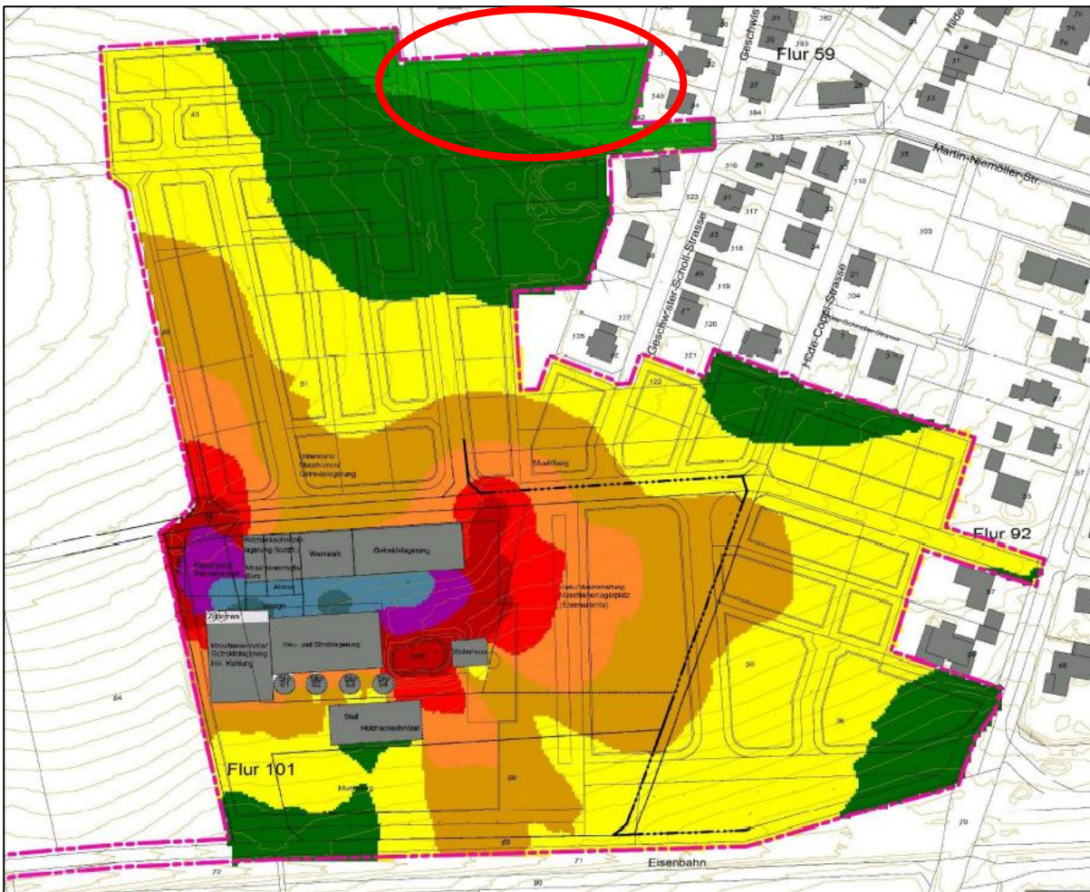
Abb. 2: Geräuschbelastung im Nachtzeitraum durch den landwirtschaftlichen Betrieb (unmaßstäblich) (TÜV Hessen, 2019)

Der nächtliche Immissionsrichtwert laut 6.1 g) (TA Lärm) in Kugebieten, für Krankenhäuser und Pflegeanstalten liegt bei 35 dB(A). In der schalltechnischen Untersuchung vom TÜV Hessen wurde errechnet, dass wenige südliche Teile des Geltungsbereichs der Seniorenwohnanlage ca. 35 - 40 dB(A) (hellgrün) Geräuschbelastung ausgesetzt sind. Laut dieser Berechnung könnte der nächtliche Immissionsrichtwert überschritten werden. Planungsansätze des Architekturbüro Wohnbau + sehen im südlichen Teil des Geltungsbereichs Räume für ergänzende Dienstleistungseinrichtungen (SO II) sowie betreutes Wohnen mit Service (SO III) vor. Diese Nutzungsarten haben laut TA Lärm nächtliche Immissionsrichtwerte zwischen 40 und 45 dB(A). Diese Richtwerte werden eingehalten. Hinzu kommt, dass Seniorenwohnanlagen weniger von den Auswirkungen der Geräuschbelastung beeinträchtigt sind. Des Weiteren besteht der Gemeinde Wehrheim eine hohe Akzeptanz von landwirtschaftlichen Gerüchen und Geräuschen bei der Bevölkerung, da sich die Gemeinde im ländlichen Raum befindet und die Immissionen als ortsüblich wahrgenommen werden. Es sind keine Räume mit Schlaffunktion in südlicher Richtung im SO II oder SO III zulässig. Somit wird einer eventuellen Störung durch Geräuschbelastung vorgebeugt, da weiter nördlich von der Einhaltung des Immissionsrichtwerts in Kugebieten, für Krankenhäuser und Pflegeanstalten von 35 dB(A) ausgegangen werden kann.